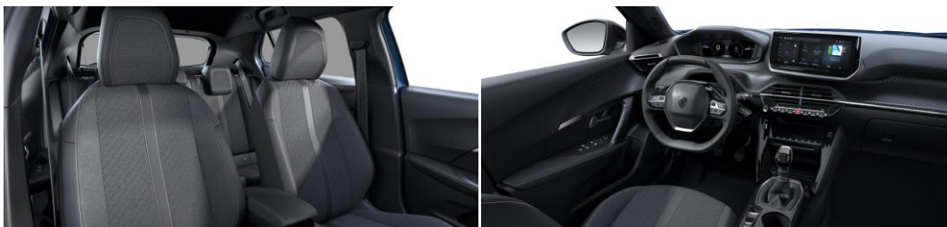
LOMSA szövetkárpit bőrbetétekkel "quartz" díszvarrással Széria - ALLURE