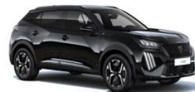
Perla Nera fekete