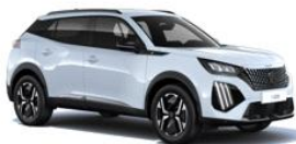
Okenite fehér (STYLE esetén széria)