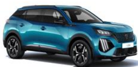
Obsession kék (ALLURE és GT esetén széria)