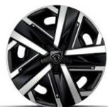
16"-os SILOM dísztárcsa Széria - STYLE