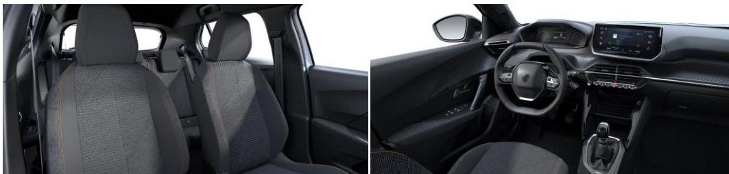
RENZO szövetkárpit "naplemente sárga" díszvarrással Széria - STYLE