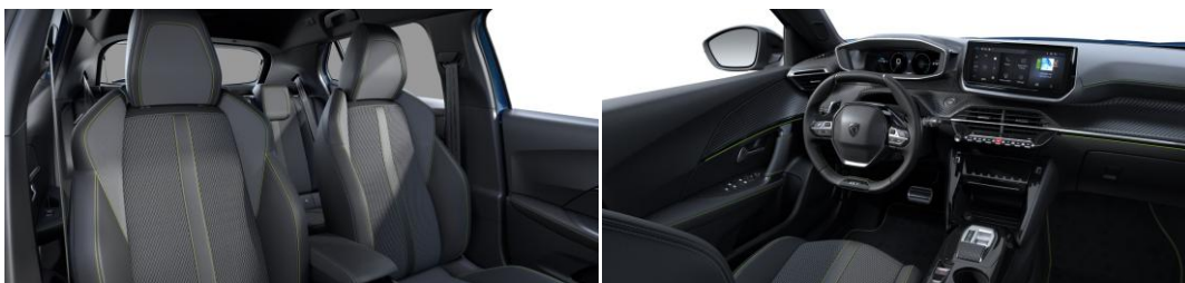
BELOMKA bőr-szövetkárpit "adamite" díszvarrással Széria - GT